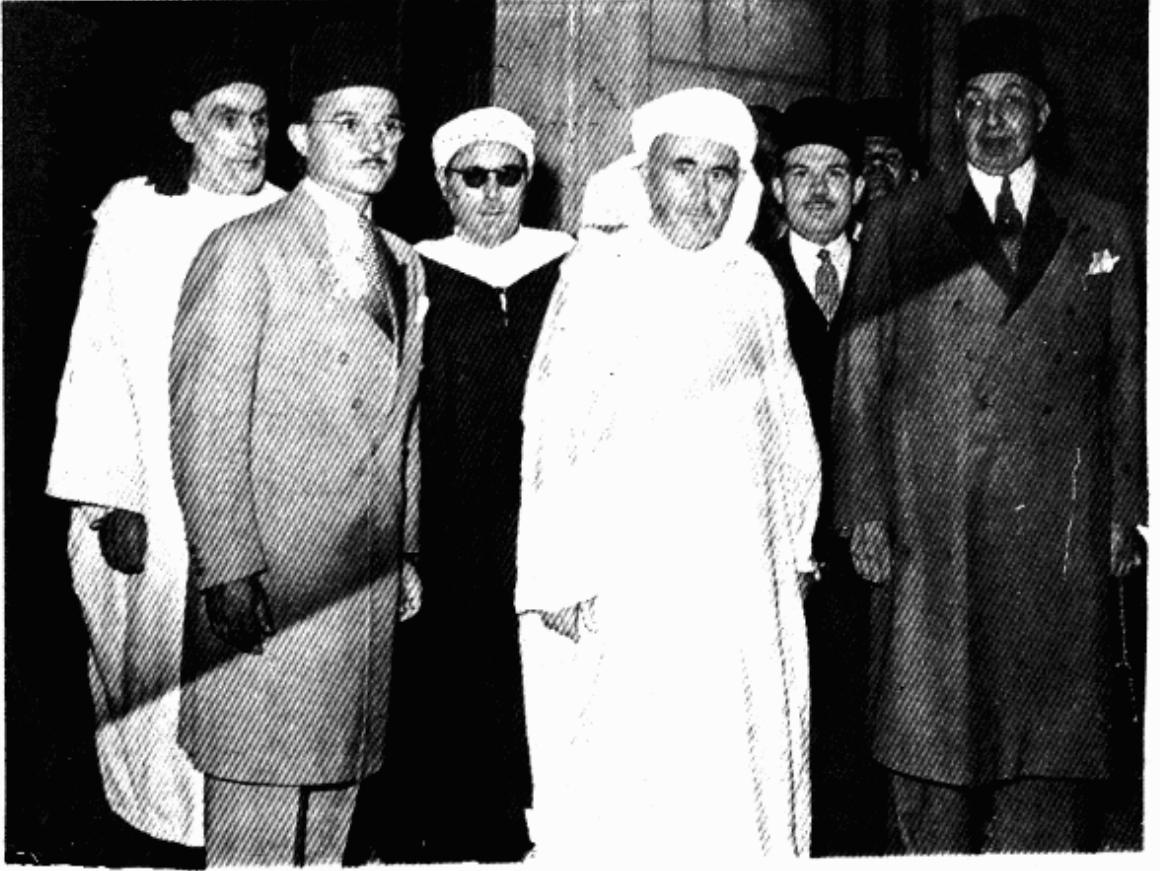
المجاهد محمد بن عبد الكريم الخطابي وعن يمينه شقيقه احمد وأحد رجال التشريقات وعمه عبد السلام، وعن يساره احمد أحمد بن عبود (المؤلف) ومحمد صالح عبد المجيد وزير الأشغال العمومية بمصر. أخذت هذه الصورة في سنة 1948 بقصر عابدين بالقاهرة عند قيام الخطابي بزيارة له بمناسبة الذكرى الأولى لنزوله بمصر.